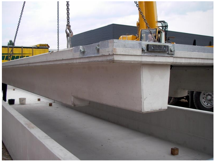
Kantenschutz inklusive Stoßfänger feuerverzinkt, mit Elastomergummipolsterung Rutschsichere Oberfläche

Mit unseren Digital-Wägeterminals und ausgereifter Wägesoftware „Winweigh“ wird die extrabreite Agri XL 2013 zu einer leistungsfähigen Wäganlage.