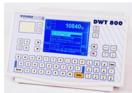
Wägeplattform Meteor 1010 Wägeindikatoren DWT 800 und D 70